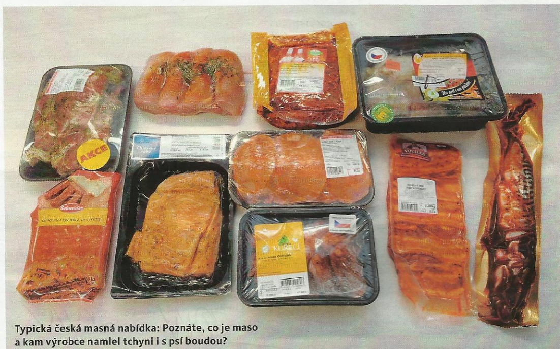
Typická česká masná nabídka: Poznáte, co je maso a kam výrobce namlel tchyni i s psí boudou?

Na Radiožurnálu to ještě celkem diplomaticky formuloval Jan Katina, ředitel Českého svazu zpraco-